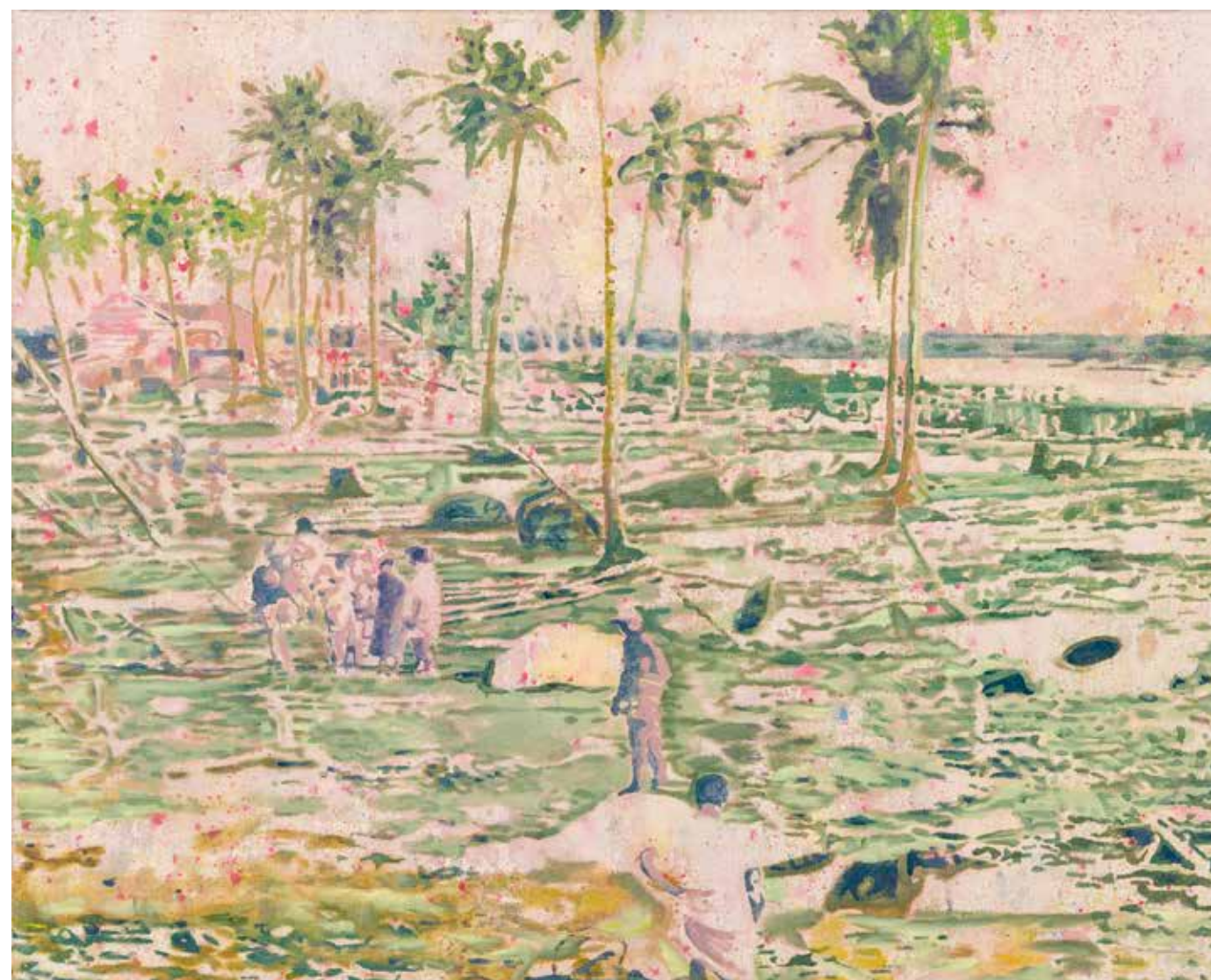
A Day After, 2020, olje, platno, 48 x 60 cm