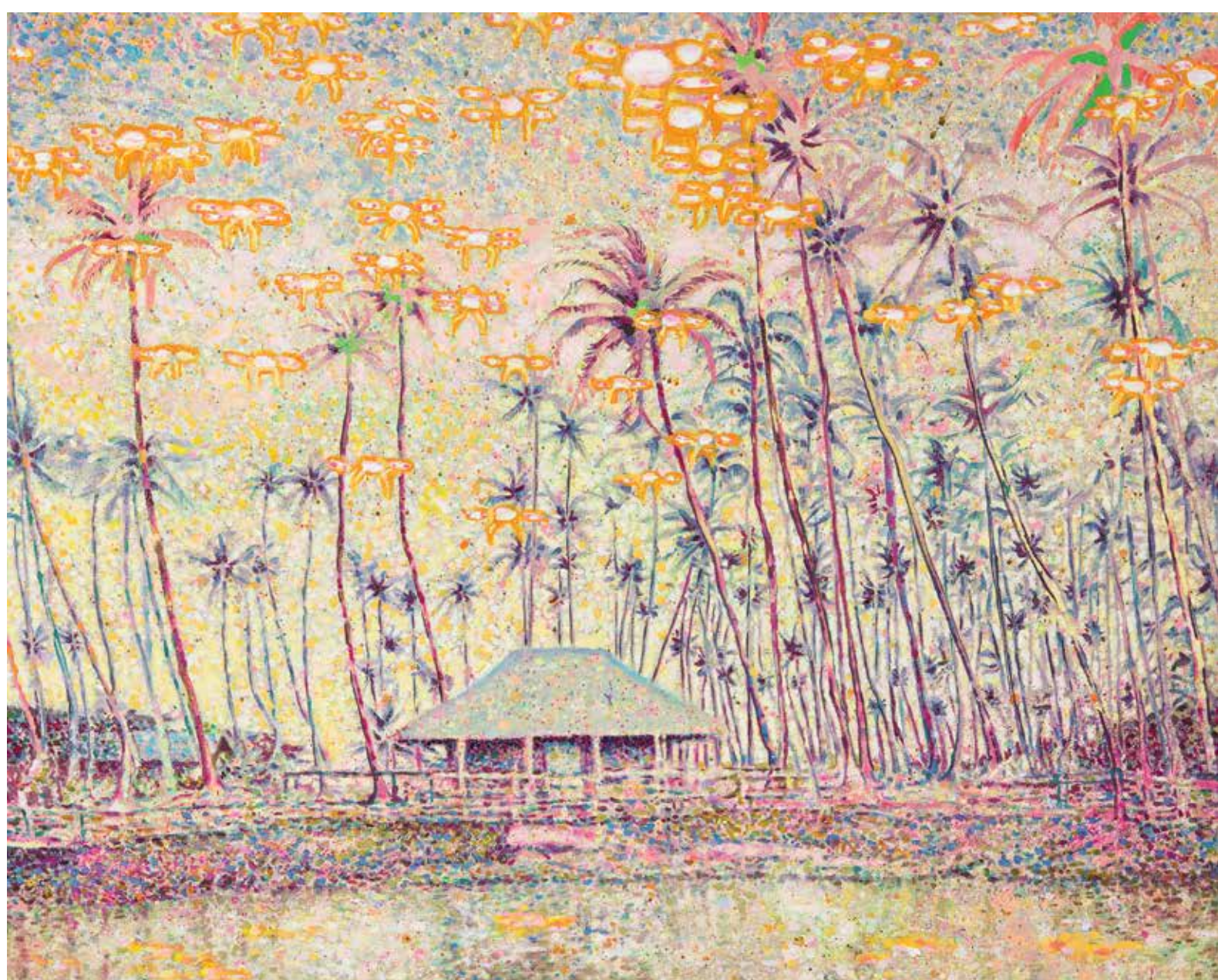
Leper's Paradise, 2020, akril, olje, platno, 81 x 100,5 cm