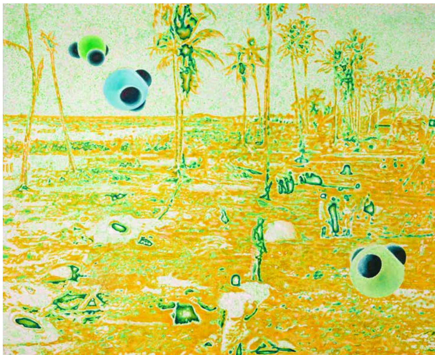
Holiday Inn, 2020, akril, olje, platno, 150,5 x 190 cm