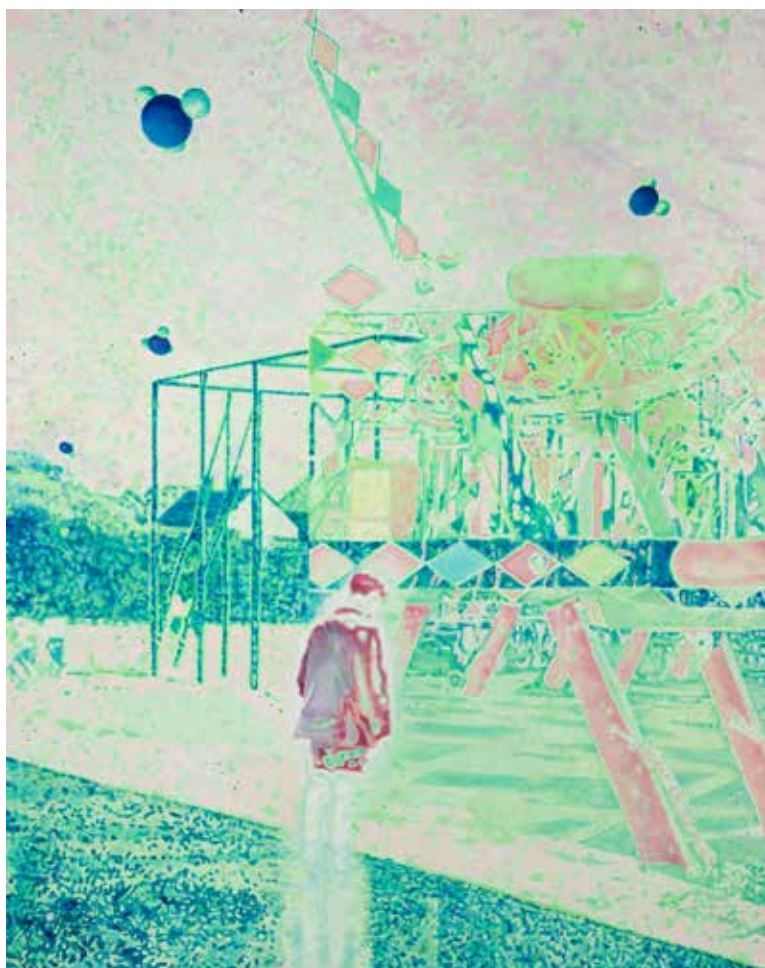
The Void, 2020, akril, olje, platno, 190 x 150,5 cm