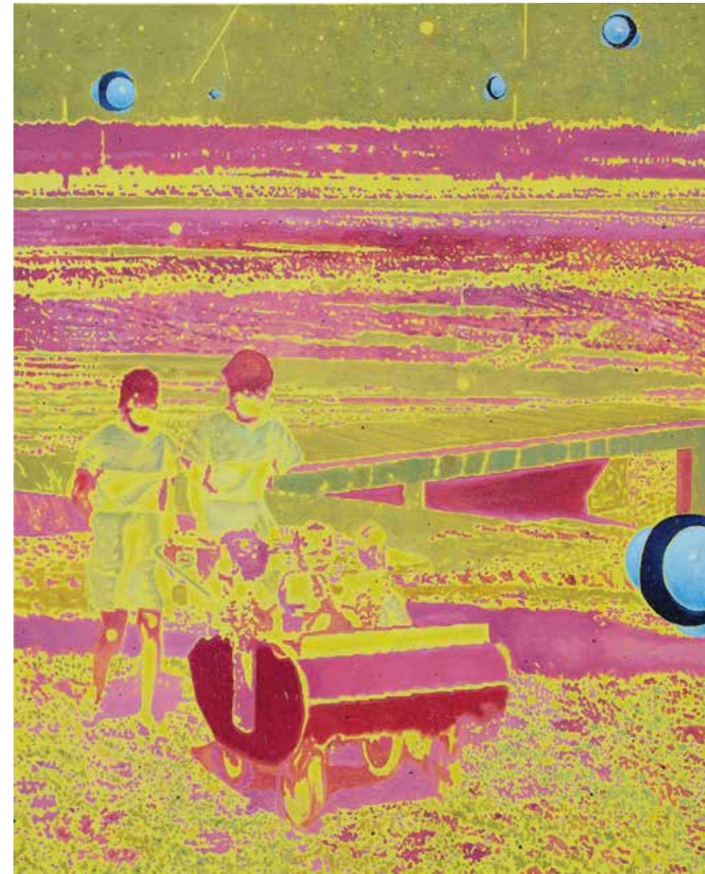
Lonely Planet, 2021, olje, platno, 151 x 121 cm