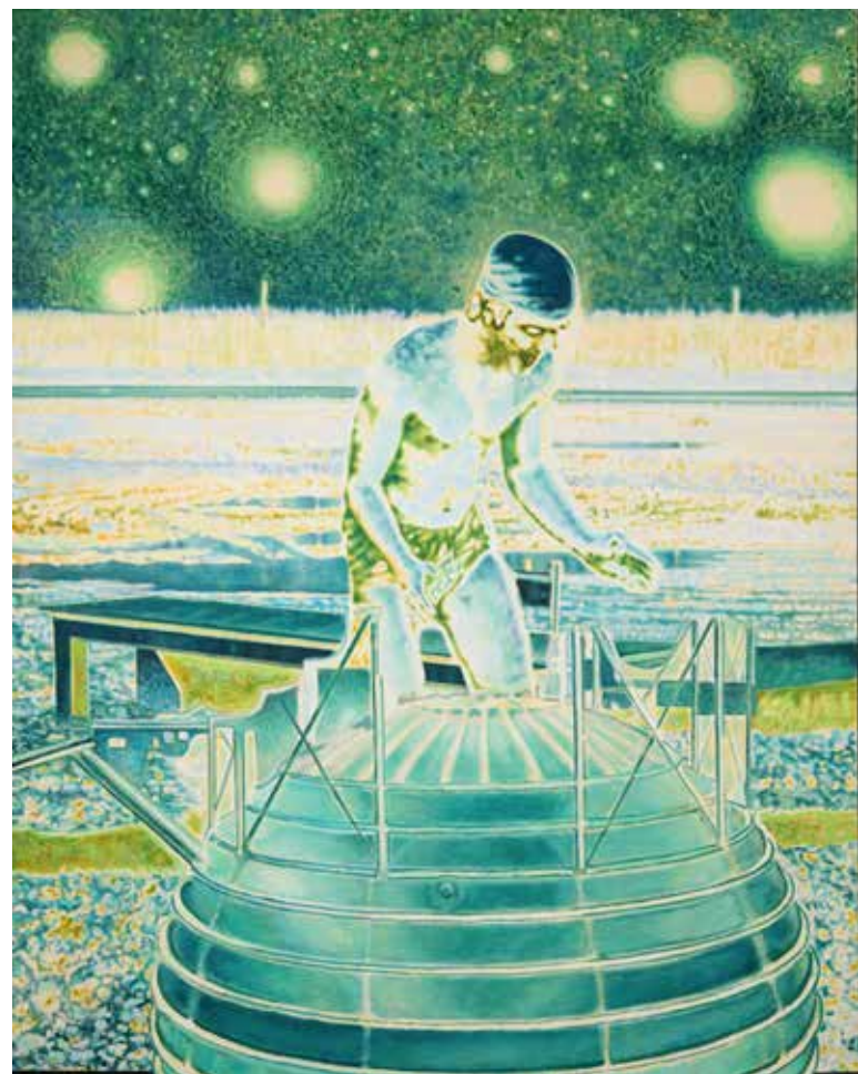
Colossal, 2020, akril, olje, platno, 190 x 150,5 cm