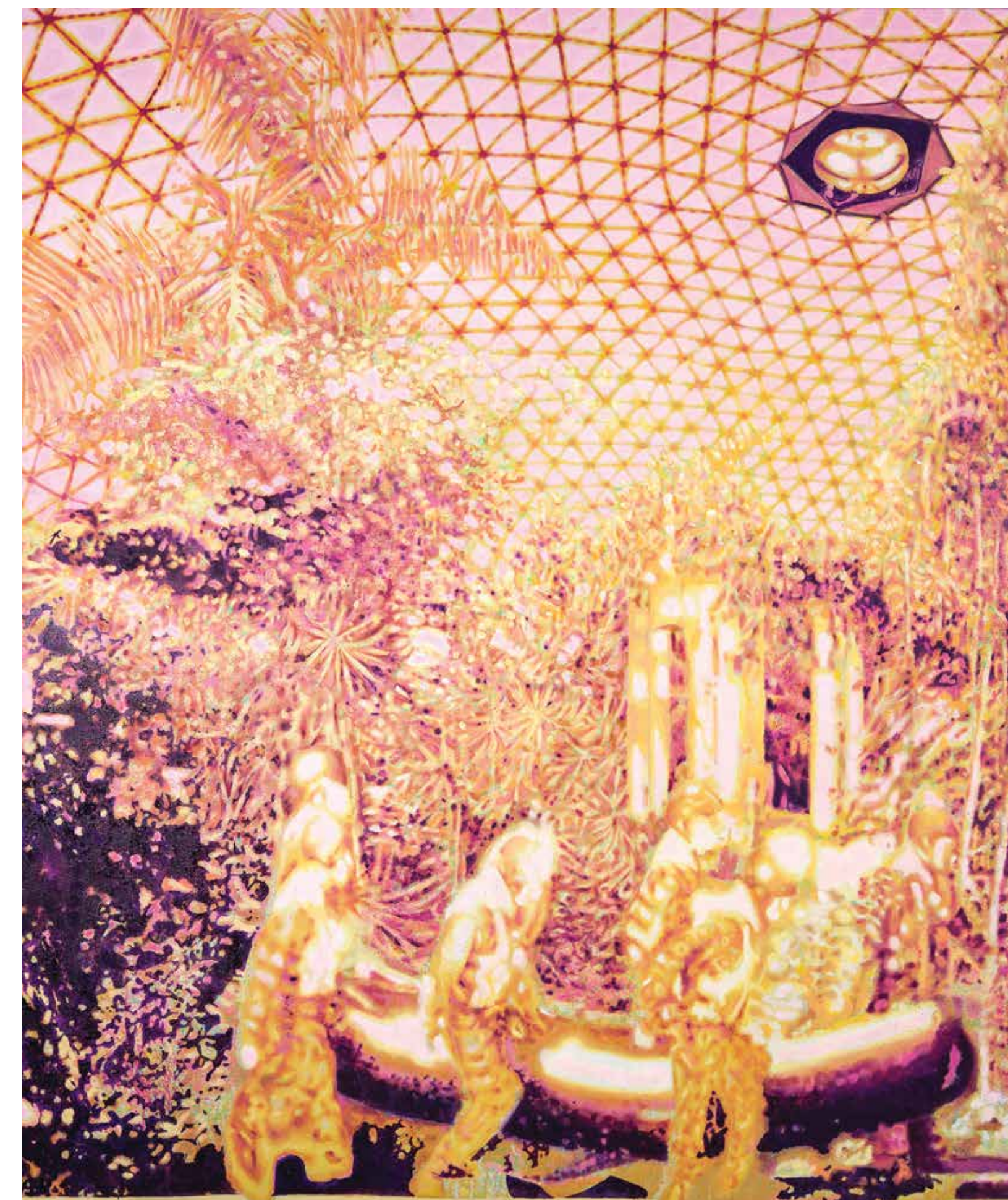
The Colony, 2021, olje, platno, 201 x 171 cm