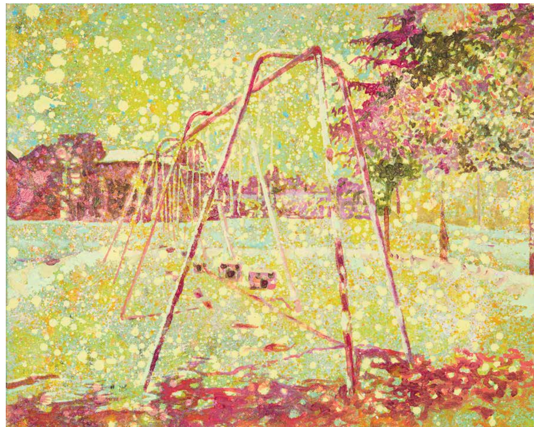
Ghost Town, 2020, akril, olje, platno, 50 x 65 cm