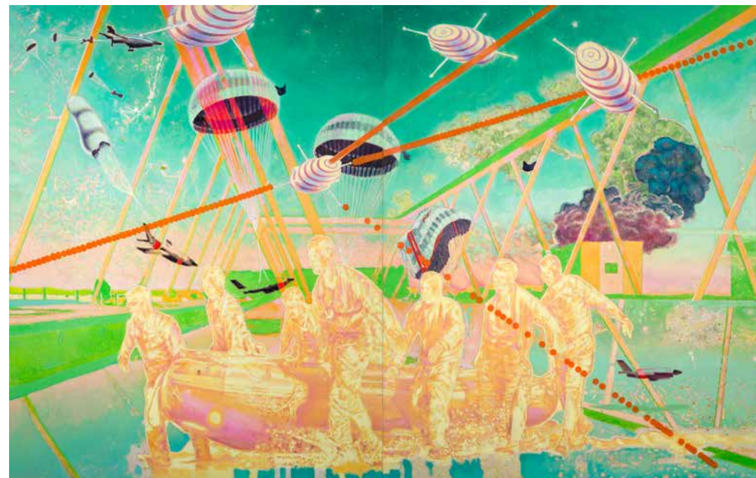
The Projectory Lab, 2021, olje, platno, 200,5 x 312 cm