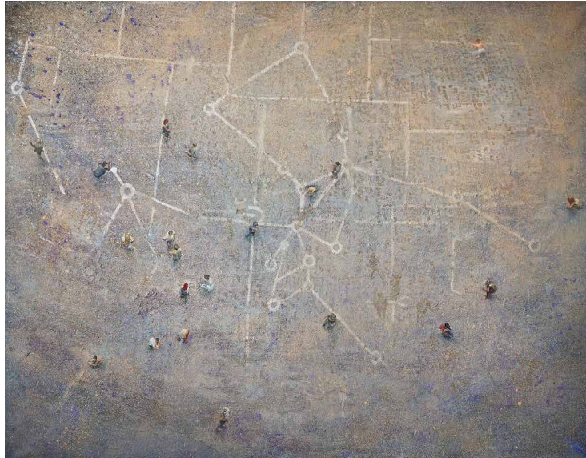
Zemljemerci, 2020, olje, platno, 120 × 160 cm