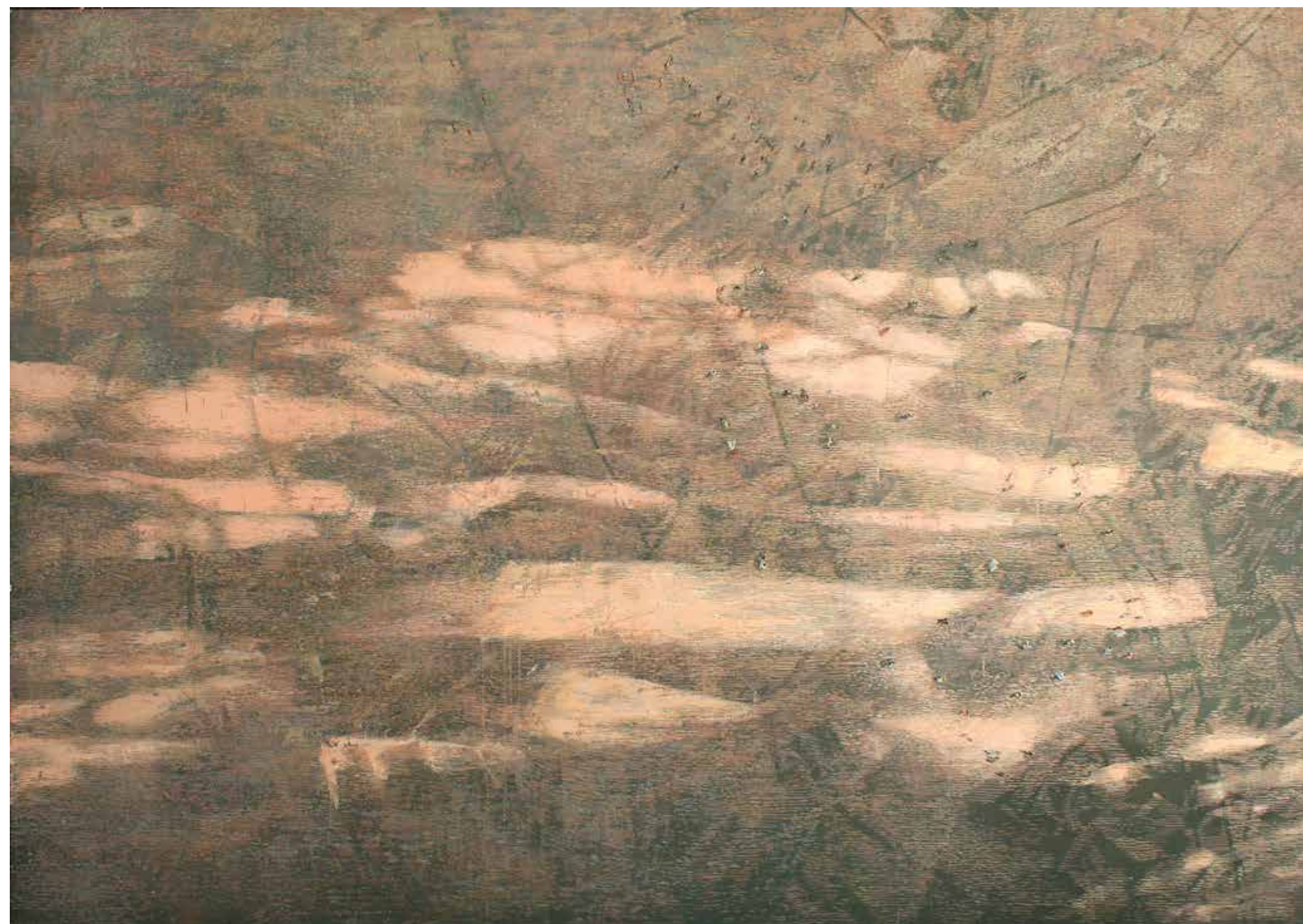
Globoko nad nami, 2014, olje, platno, 170 x 240 cm