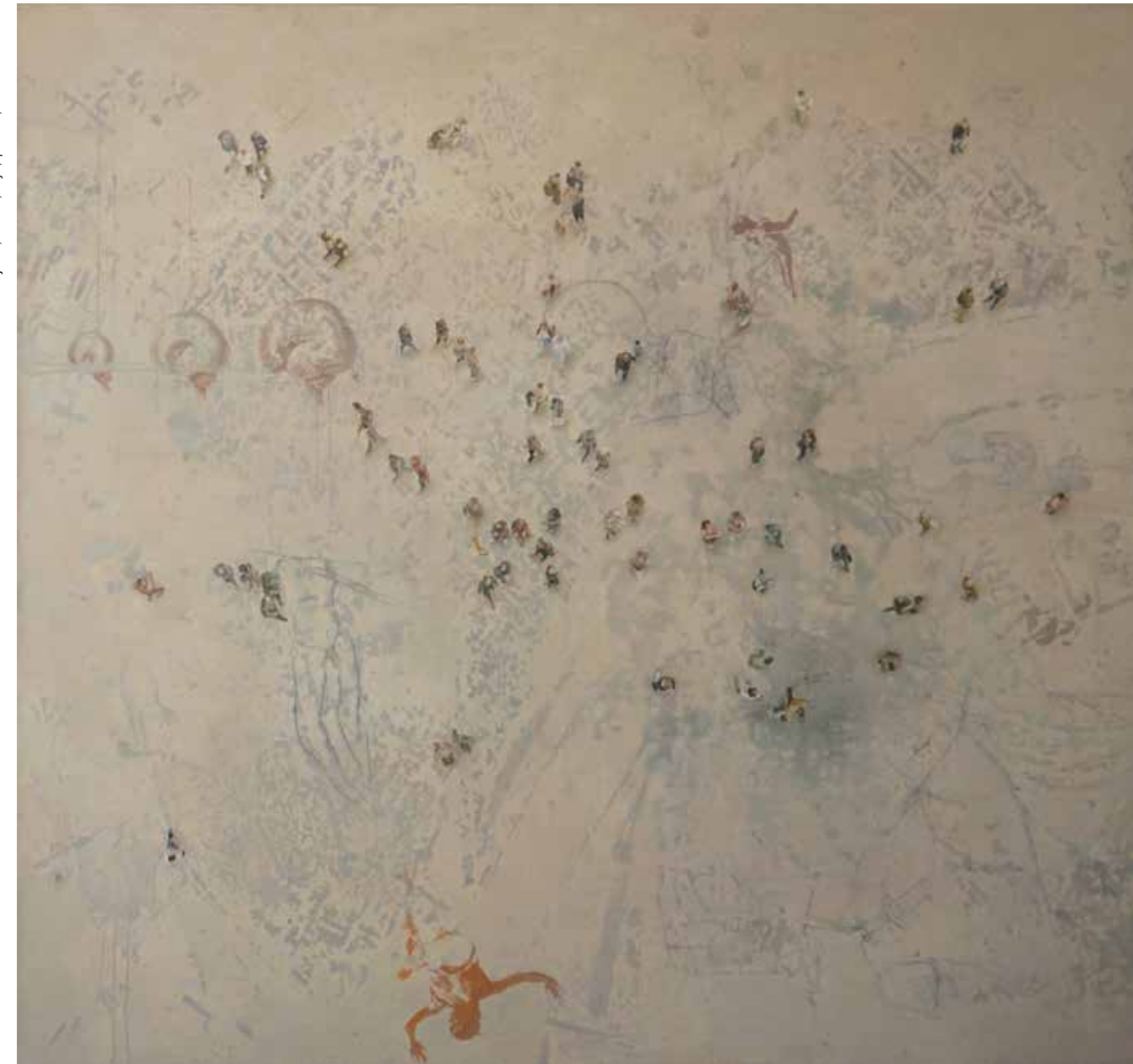
Nesveta zemlja, 2011, olje, platno, 240 × 135 cm