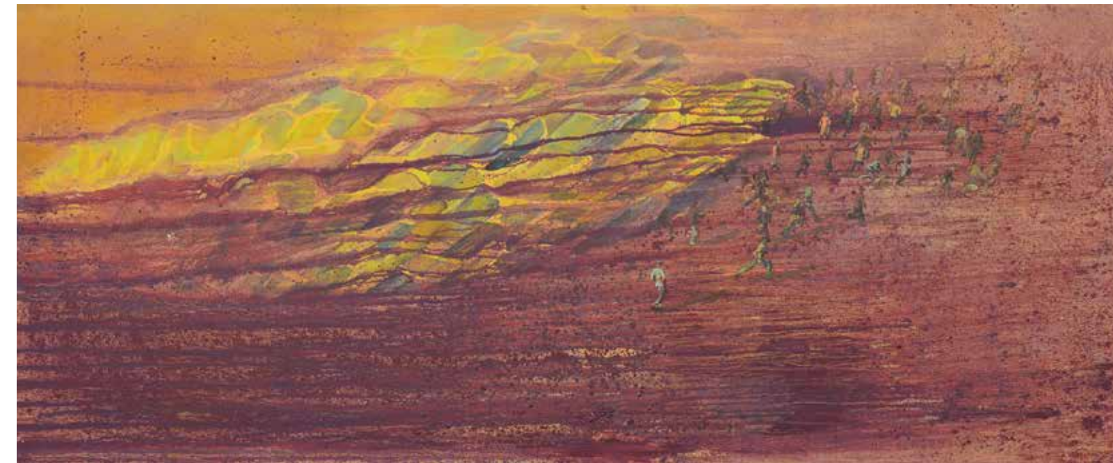
Umobežniki, 2015, olje, platno, 100 × 240 cm