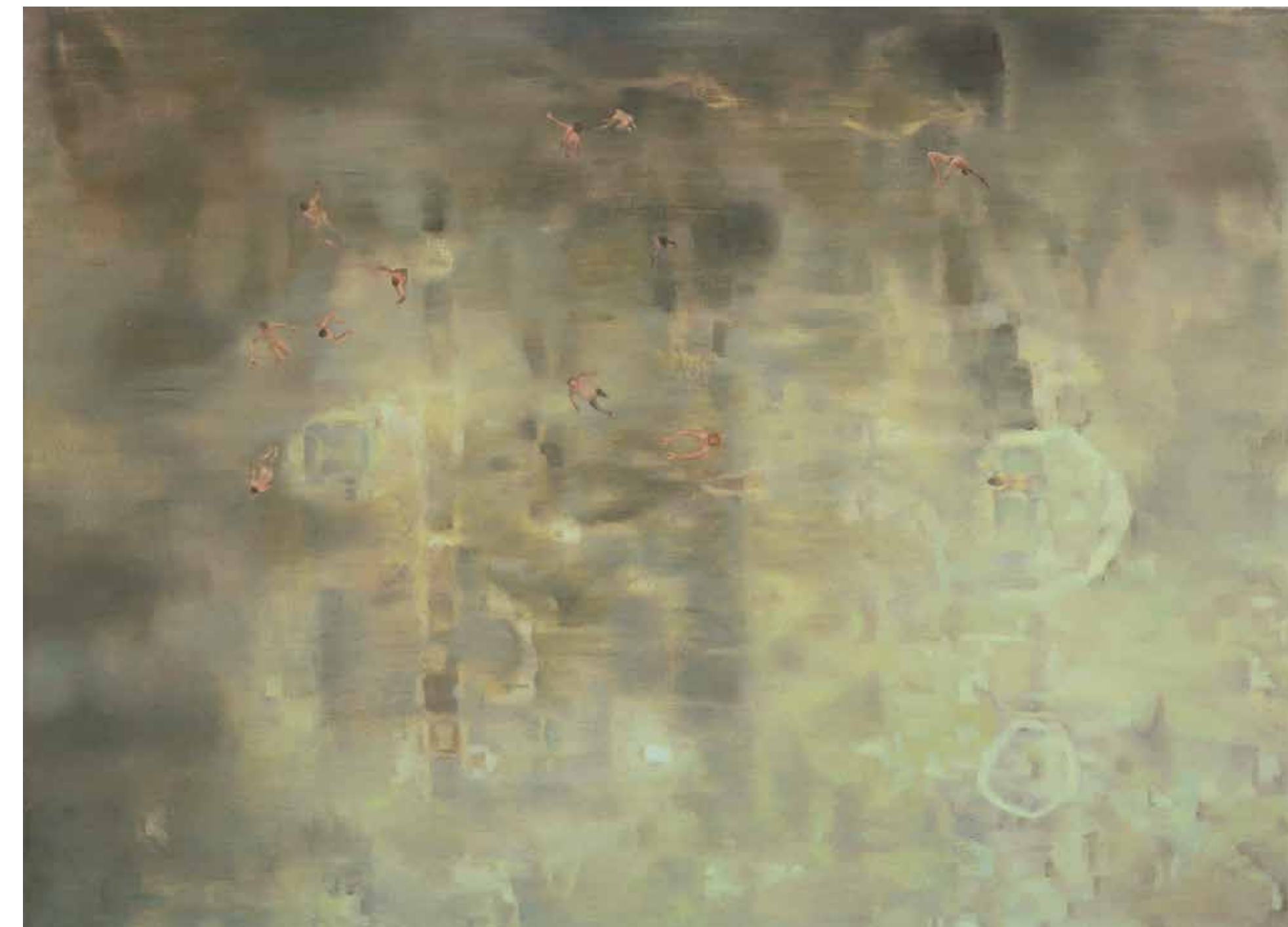
Padle zvezde, 2015, olje, platno, 130 x 180 cm