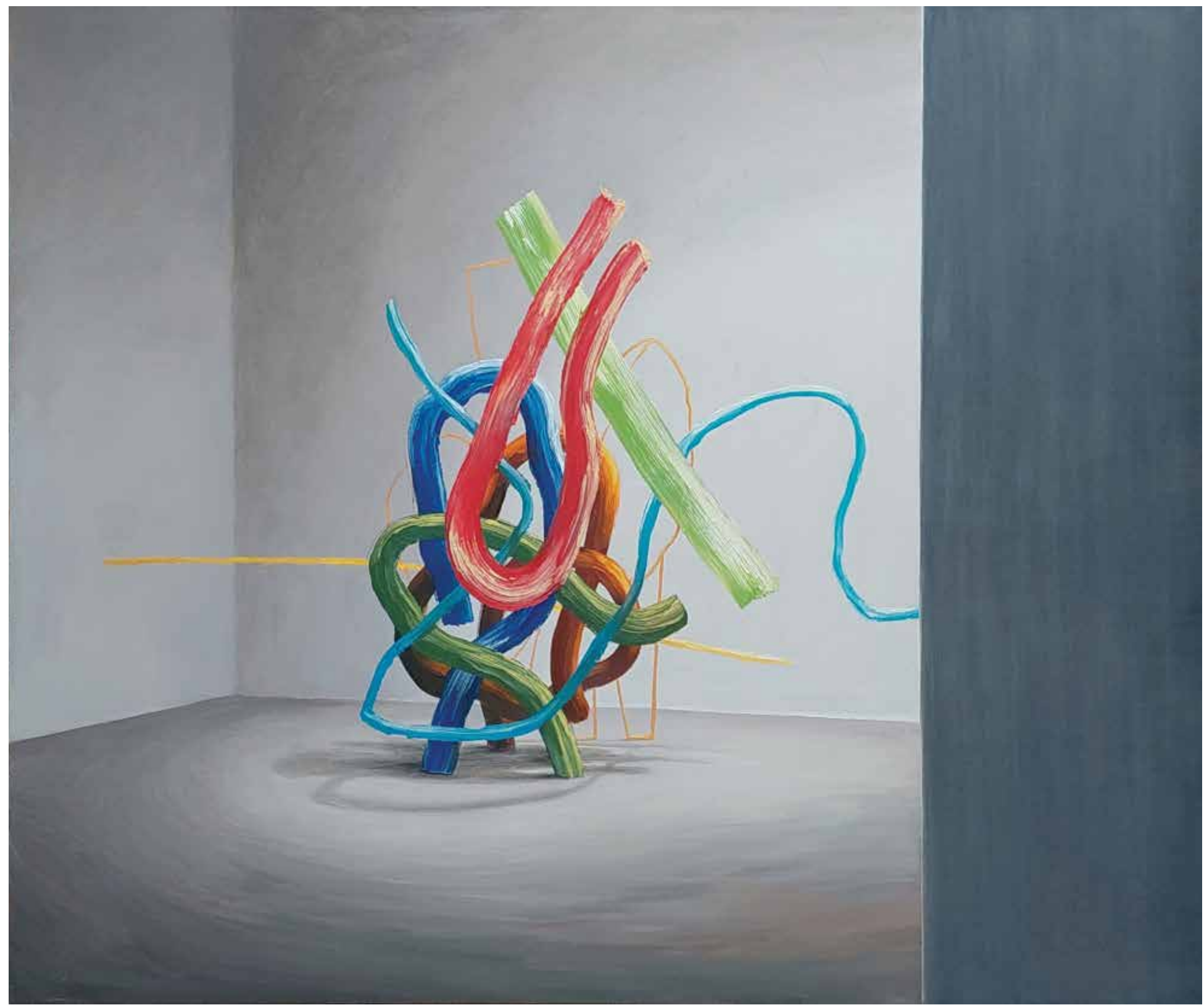
In zakaj sloni?, 2022, olje, platno, 170 x 207 cm