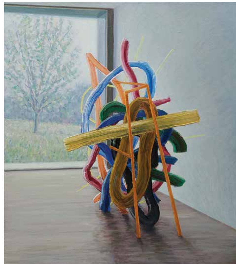
Drevo in ..., 2022, olje, platno, 90 x 80 cm