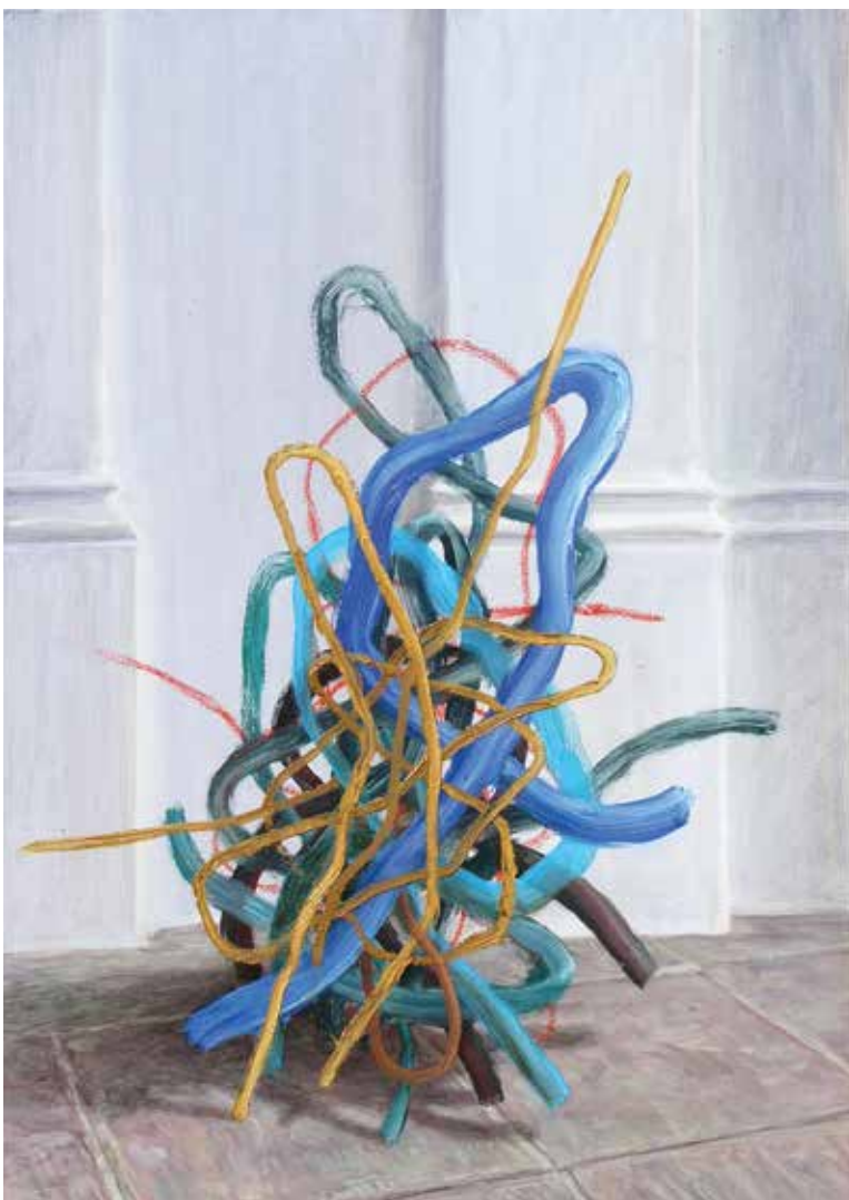
Rozamunda, 2020, olje, platno, 70 x 50 cm