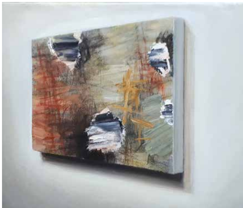
Skokian, 2021, olje, platno, 40 x 50 cm