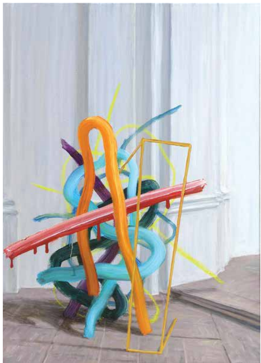
Kapljati v rdečem, 2020 olje, platno, 70 x 50 cm