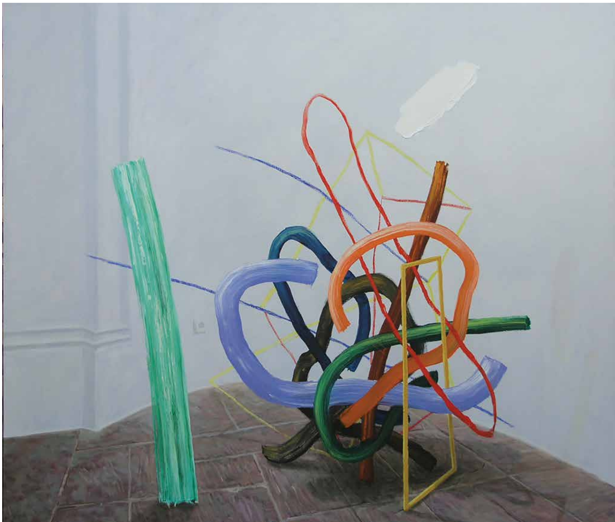
Empty roads, 2020, olje, platno, 170 x 200 cm