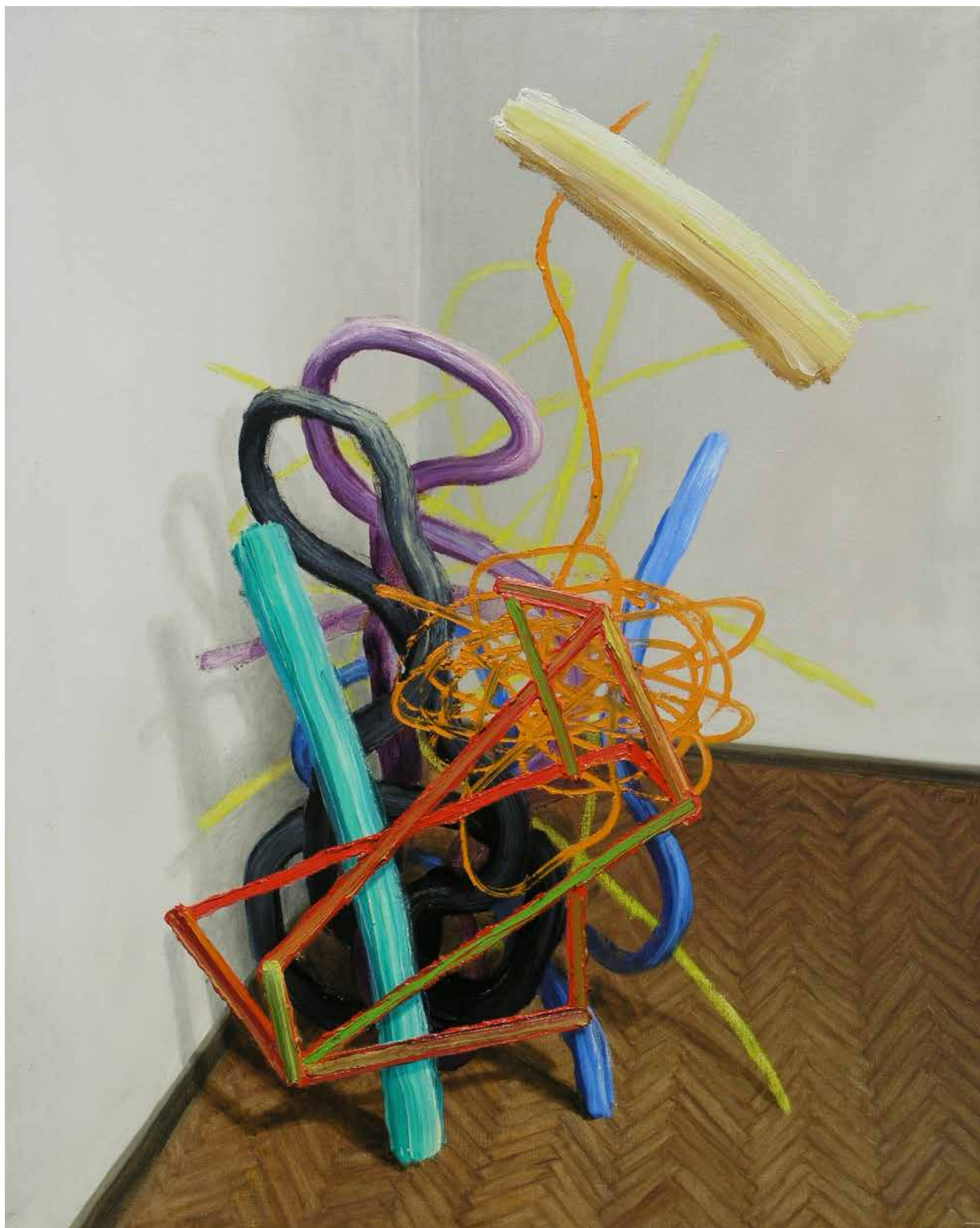
Presneto, 2021, olje, platno, 100 x 80 cm