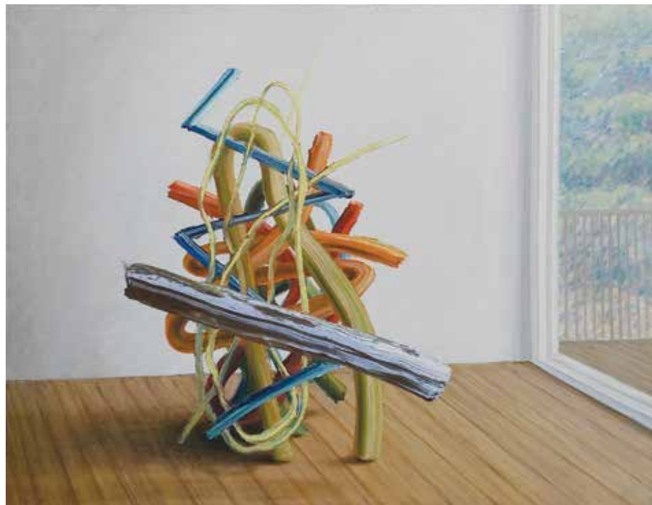
Balkon, 2022, olje, platno, 70 x 90 cm