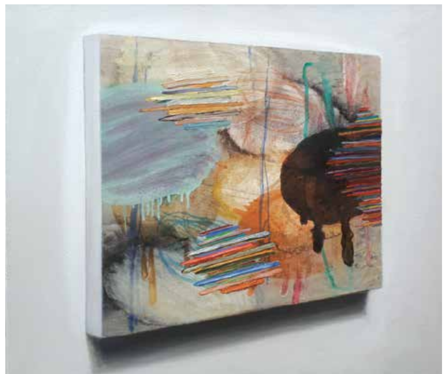
Prrr, 2022, olje, platno, 70 x 80 cm