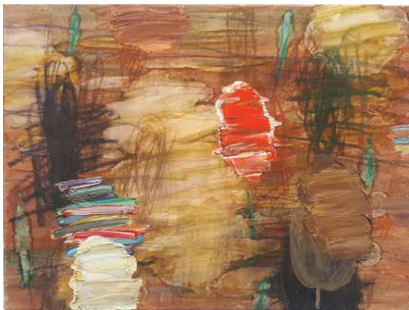
Nočni pogovor, 2021, olje, platno, 30 x 40 cm