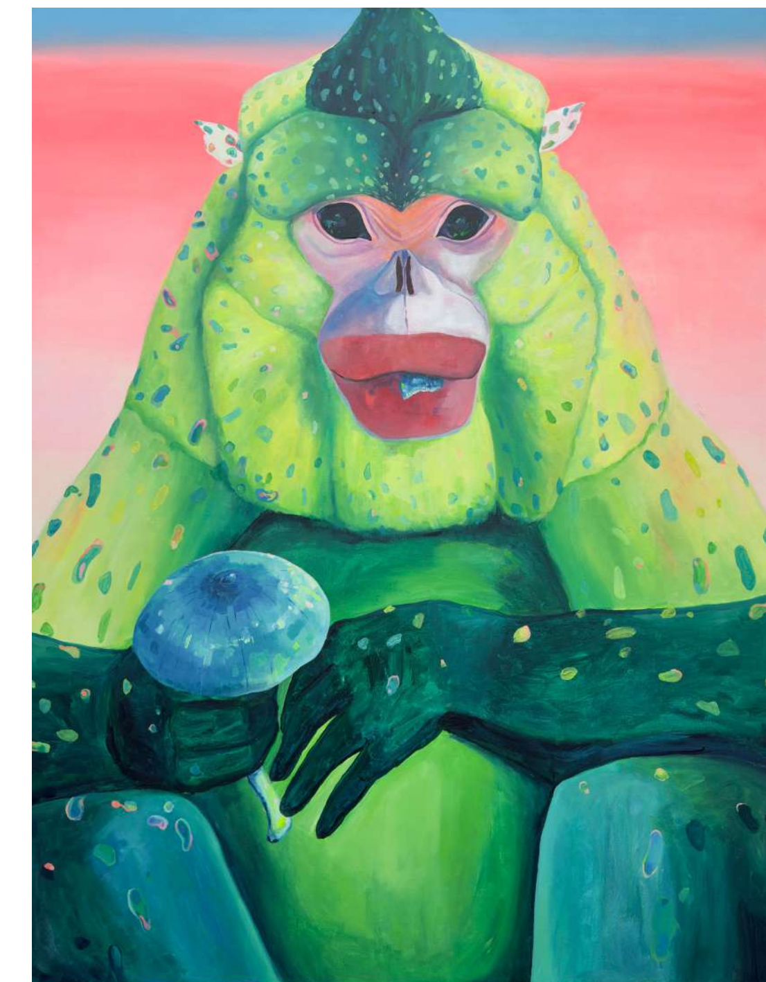
Gobe, hrana bogov, 2024, akril, platno, 130 x 180 cm

GOBE, HRANA BOGOV BARBARA KASTELEC 17. 4. 2024 – 10. 6. 2024