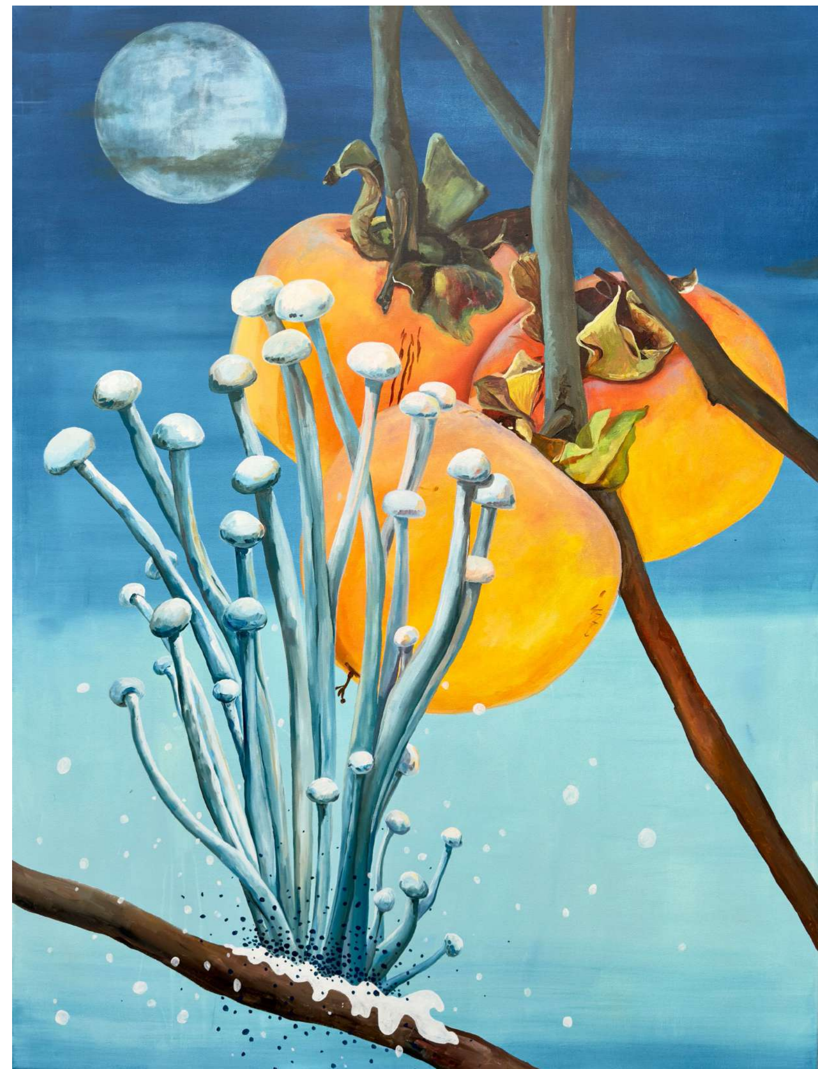
Enoki goba in polna luna, 2024, akril, platno, 130 x 180 cm