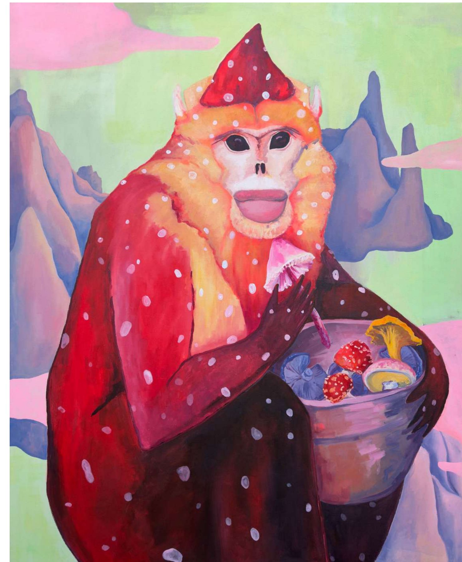
Varuhinja narave, 2024, akril, platno, 130 x 180 cm