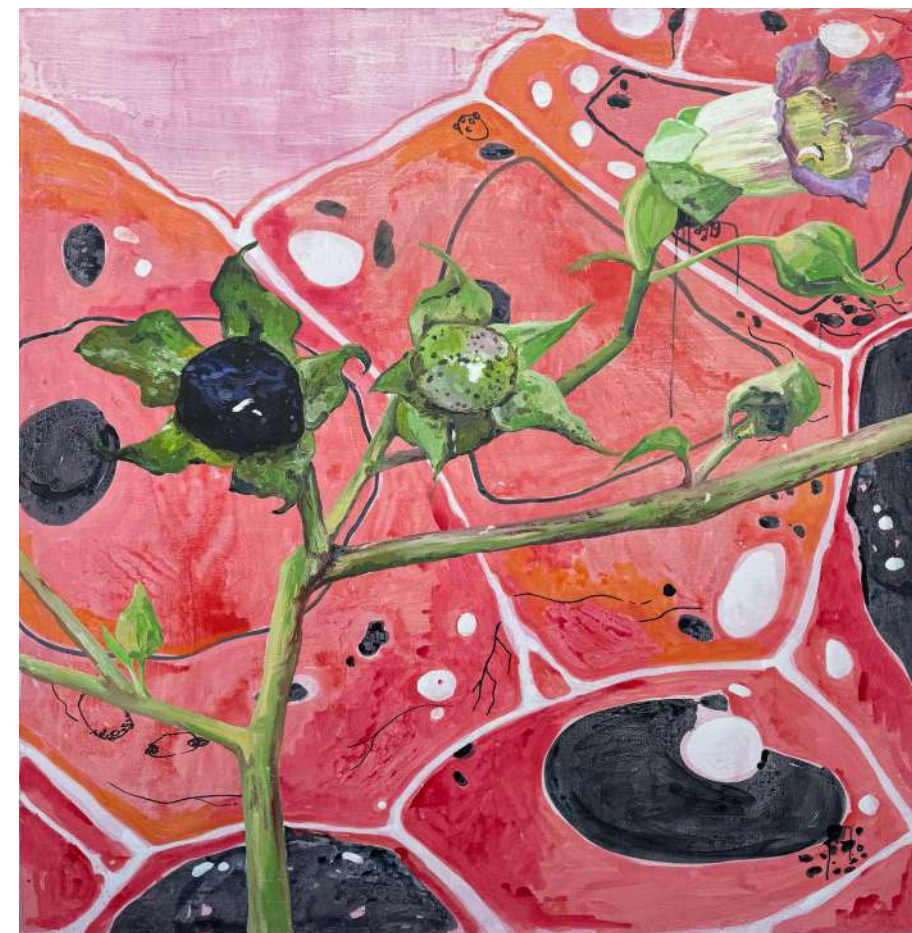
Voičja češnja, 2023, akril, platno, 150 x 180 cm