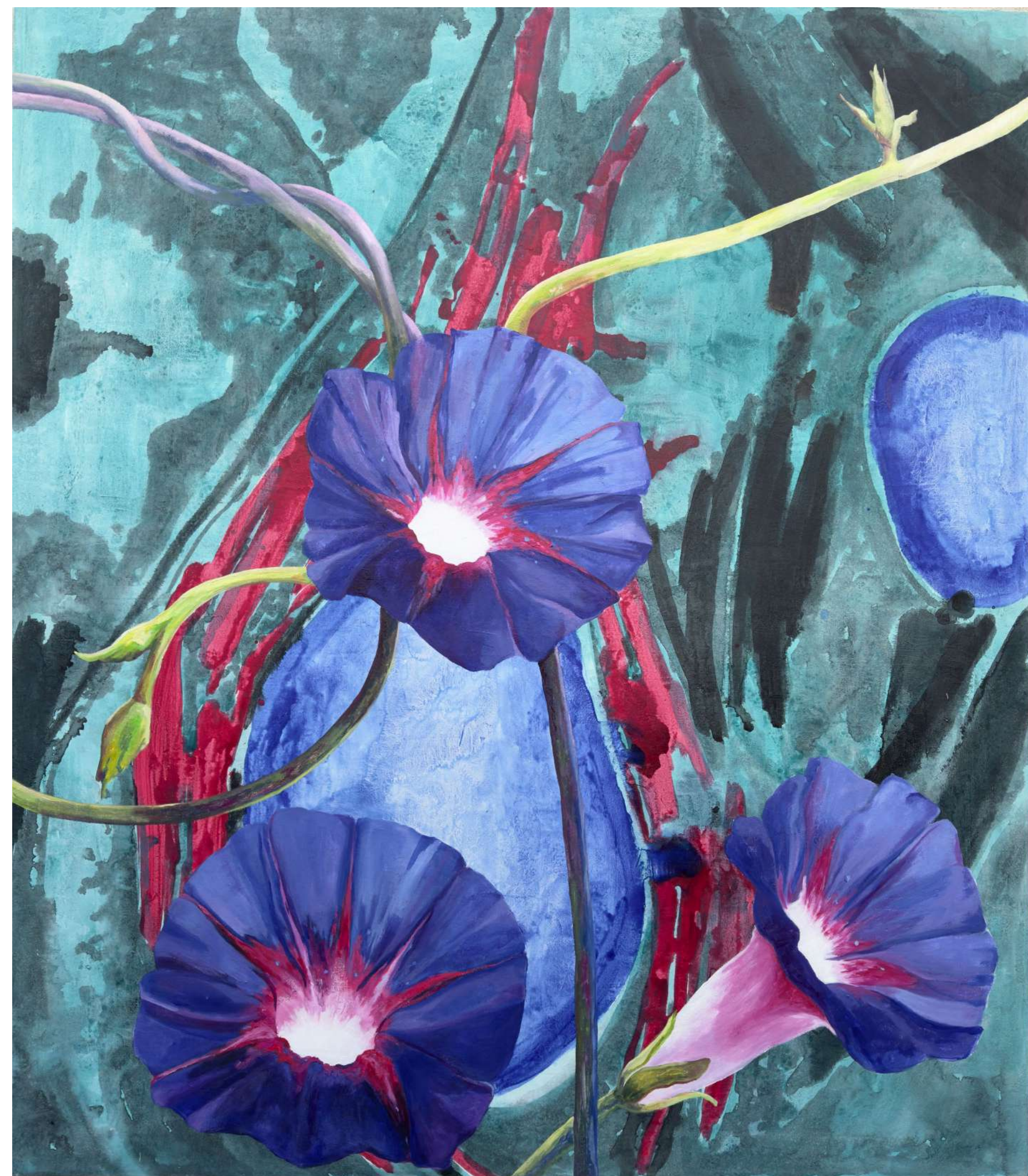
Morning glory, 2023, akril, platno, 150 x 180 cm