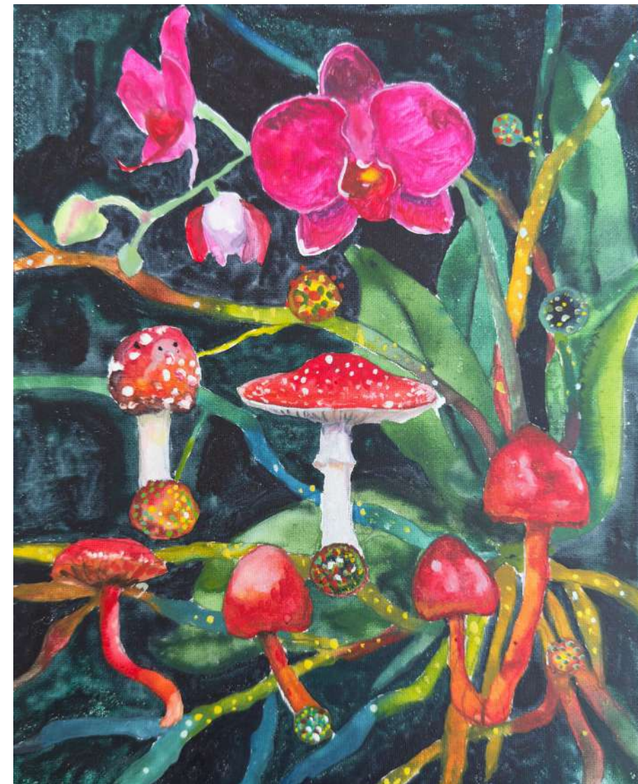
Mikoriza, 2023, akvarel, lesena plošča, 20 x 25 cm