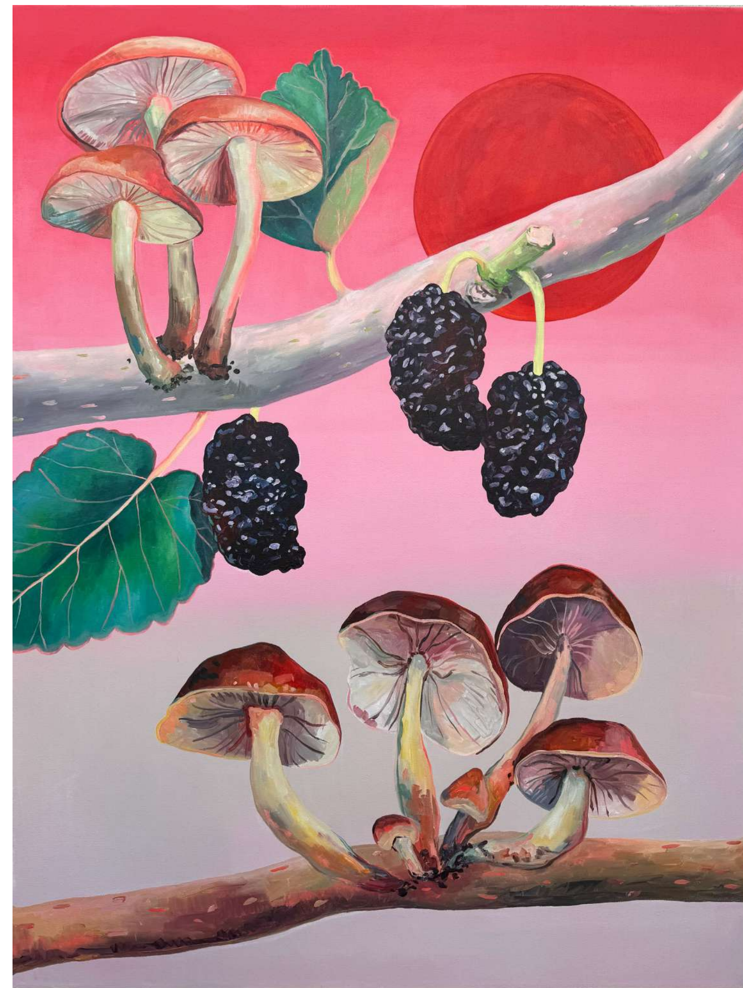
Goba enoki, 2024, akril, platno, 130 x 180 cm