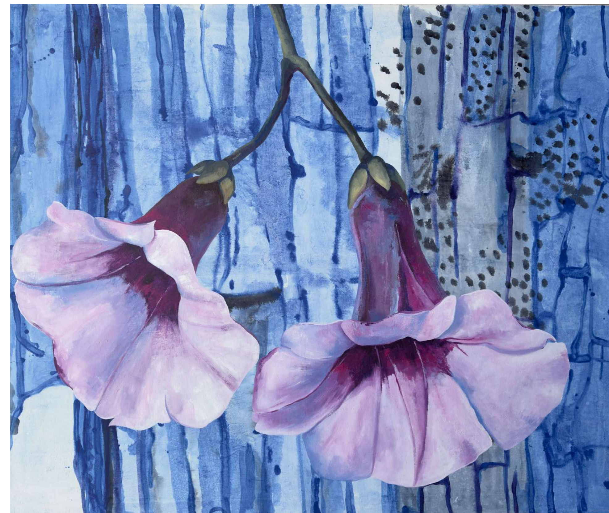
Havajska drevesna roža, 2022, akril, platno, 180 x 150 cm