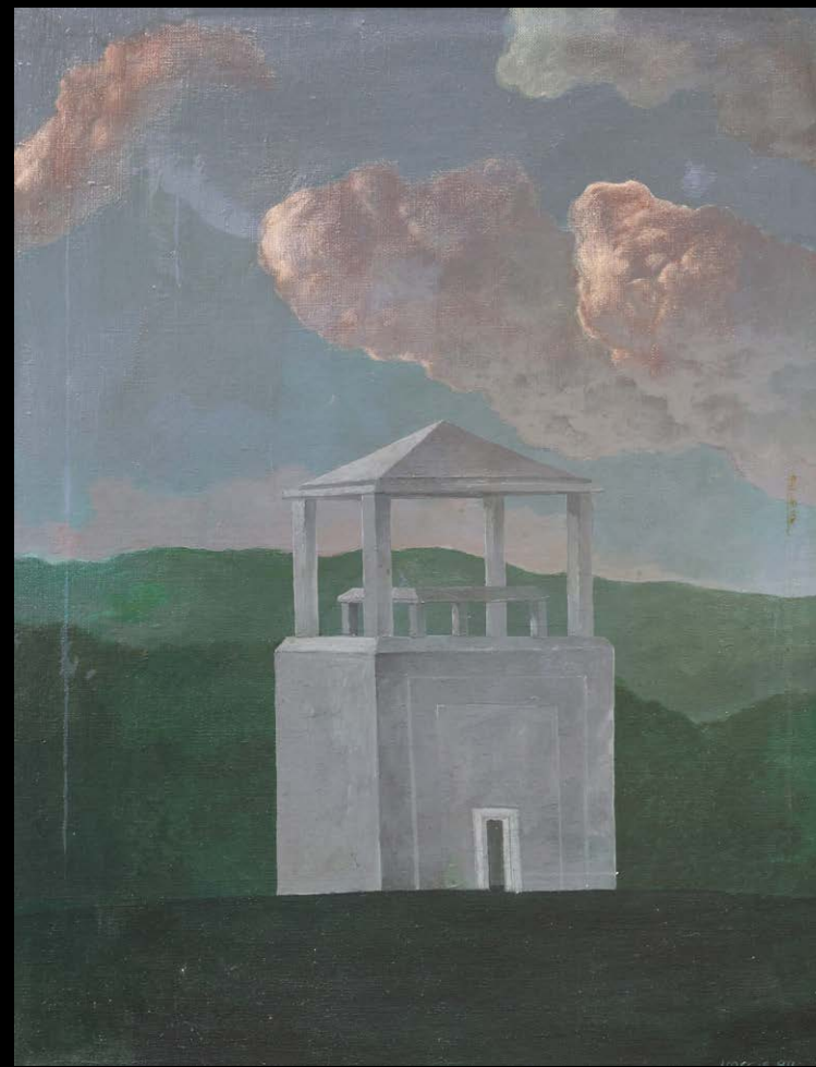
Narcis Kantardžić, Brez naslova, 1988, olje, platno, 59 x 40 cm