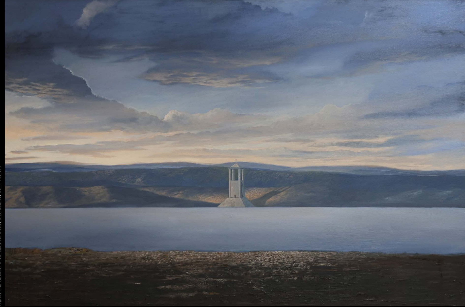
Narcis Kantardžić, Brez naslova, 2005, olje, platno, 98 x 148 cm