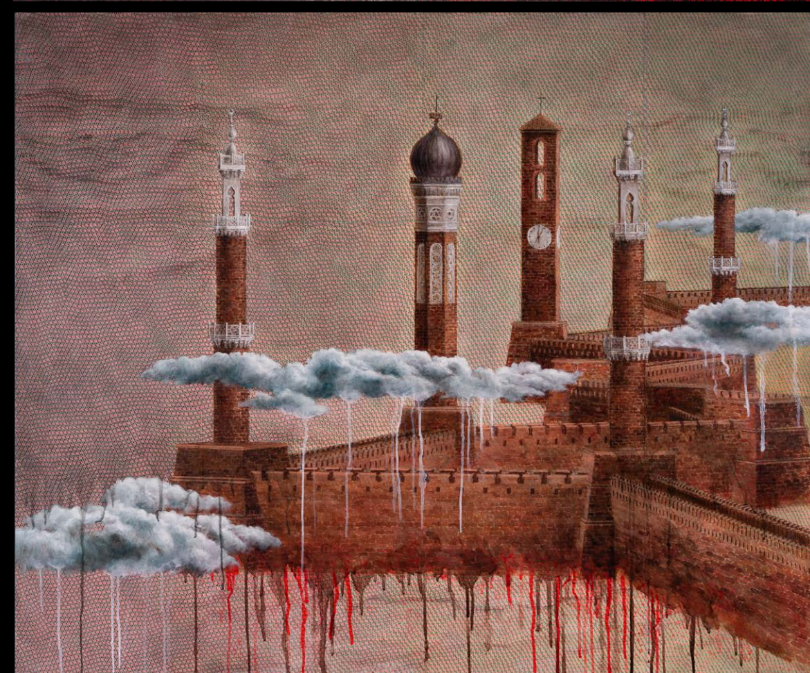
Aleksij Kopal, Kitajski zid, 2024, monotipija, akril, olje, platno, 100 x 120 cm