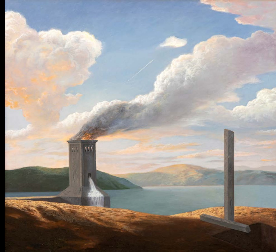
Narcis Kantardžić, Brez naslova, 2013, olje, platno, 73 x 77 cm