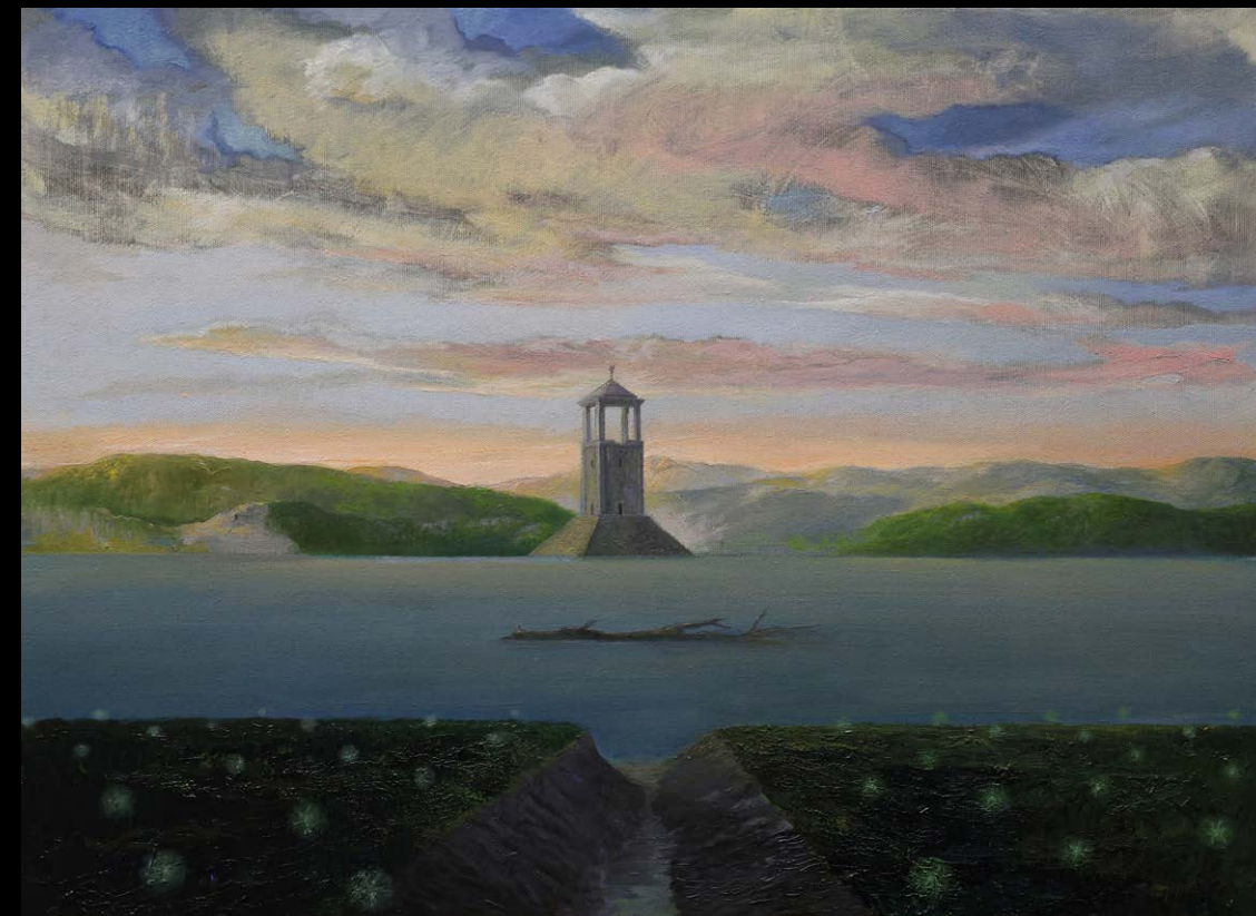
Narcis Kantardžić, Brez naslova, 2025, olje, platno, 70 x 50 cm