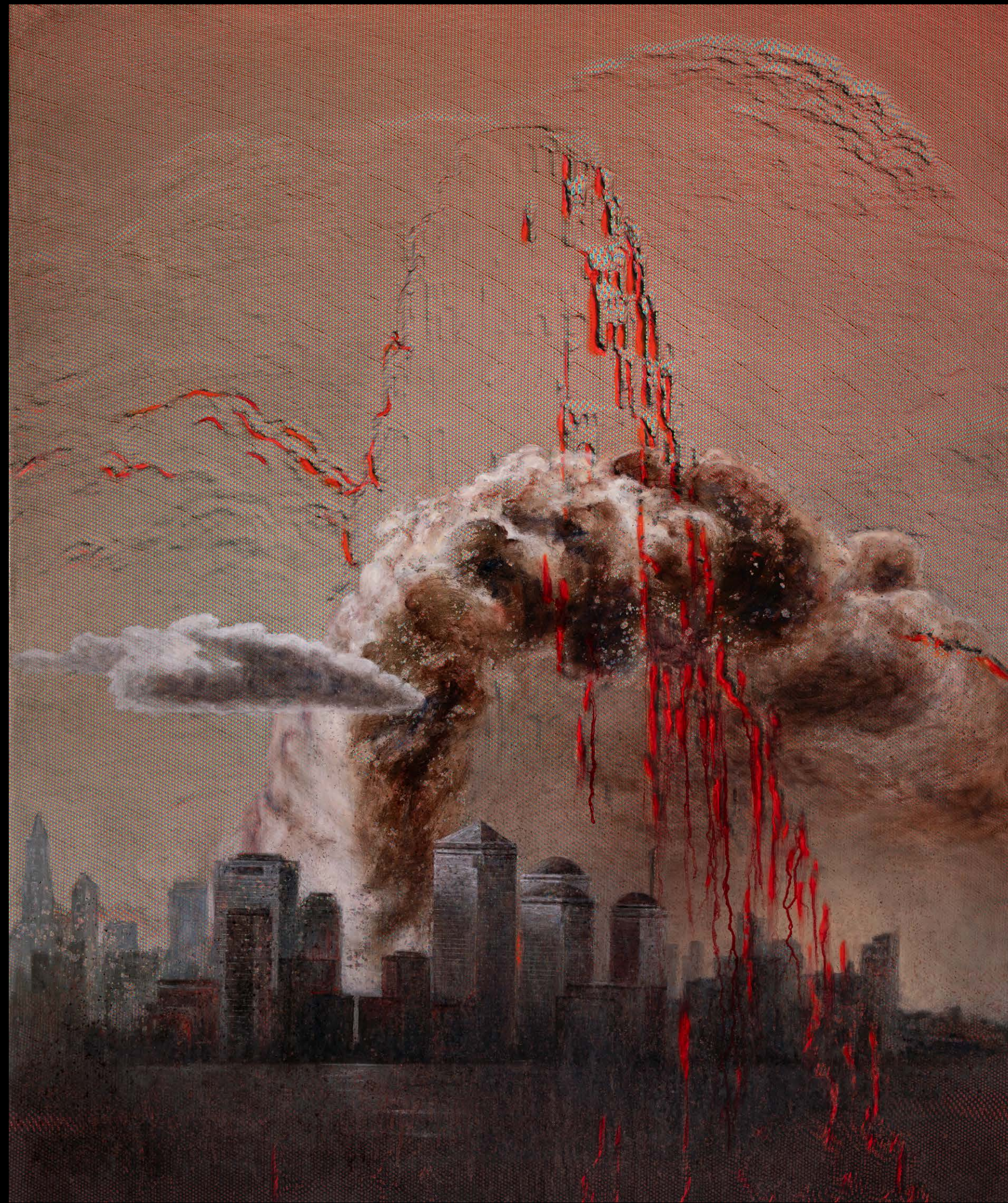
Aleksij Kopal, Narcisov stolp, 2025, print računalniške matrice, akril, olje, platno, 120 x 100 cm