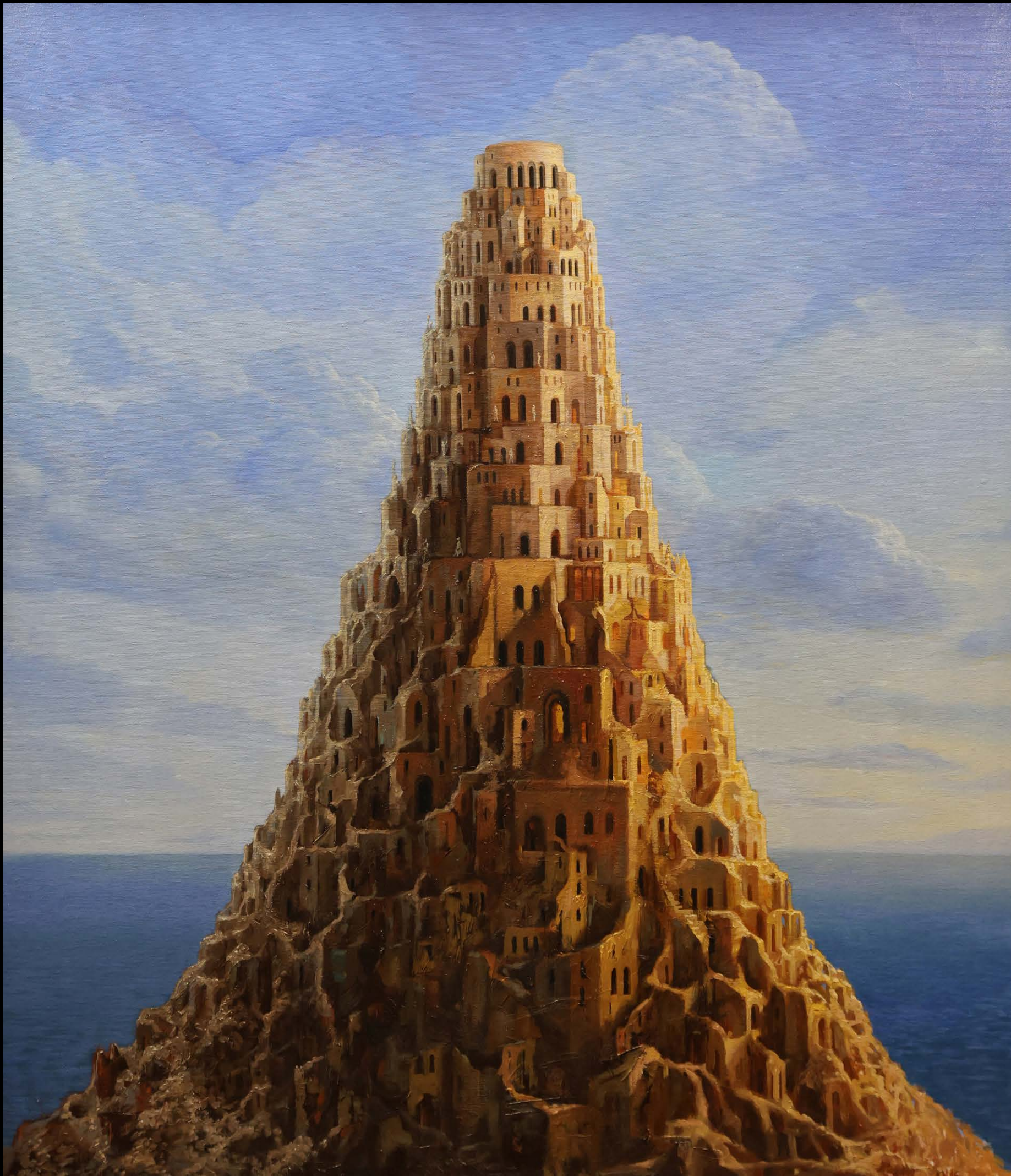
Narcis Kantardžić, Babilonski stolp, 2016, olje, platno, 120 x 100 cm