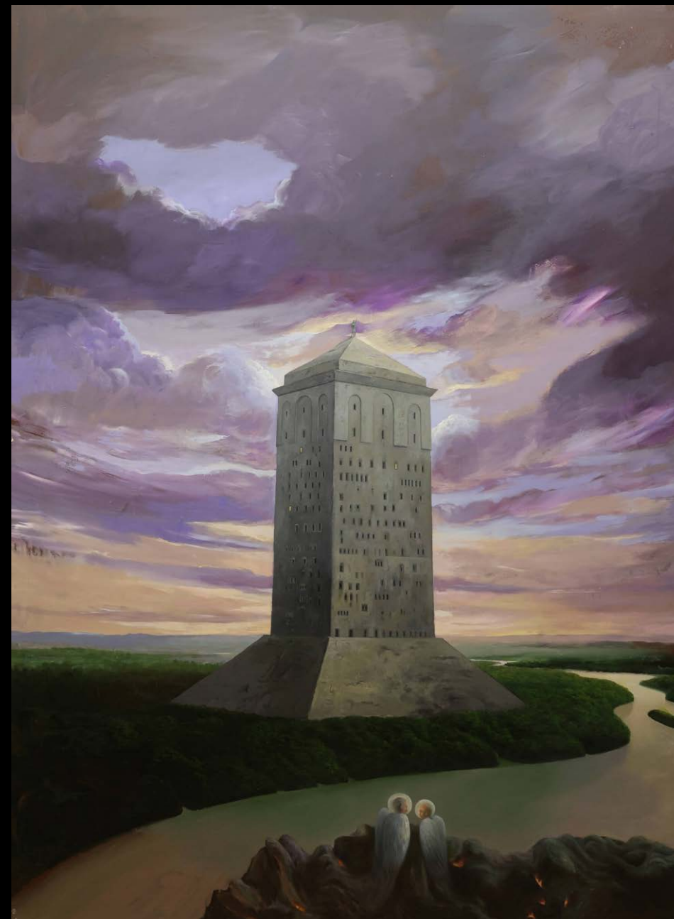
Narcis Kantardžić, Brez naslova, 2025, kovinska ploščica, olje, 209 x 150 cm