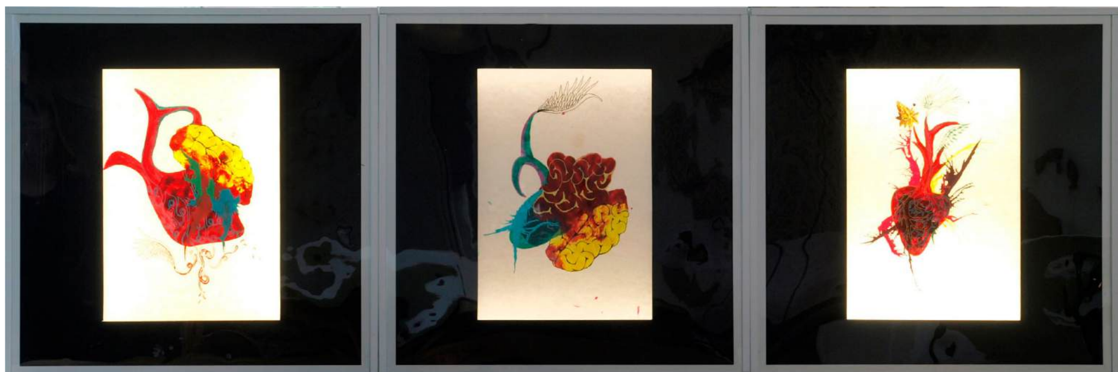
10. do 12. Puščavski dež, 2025, akril, posca flomastri, papir (svetlobnik), 6 x 60 x 60 cm