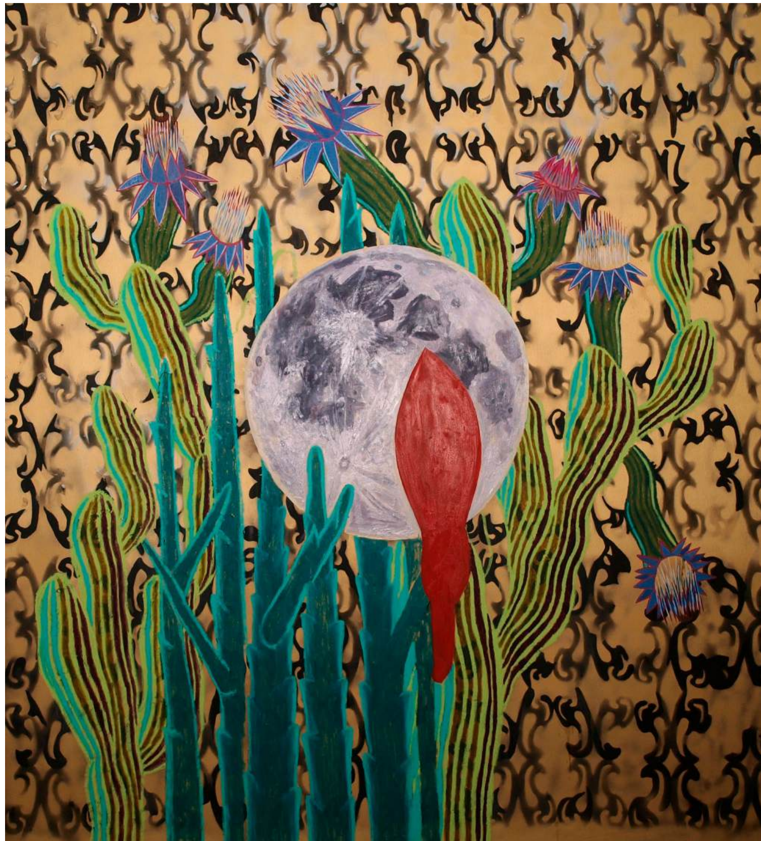
13. luna, 2026, oljni pastel, olje, platno, 190 x 170 cm