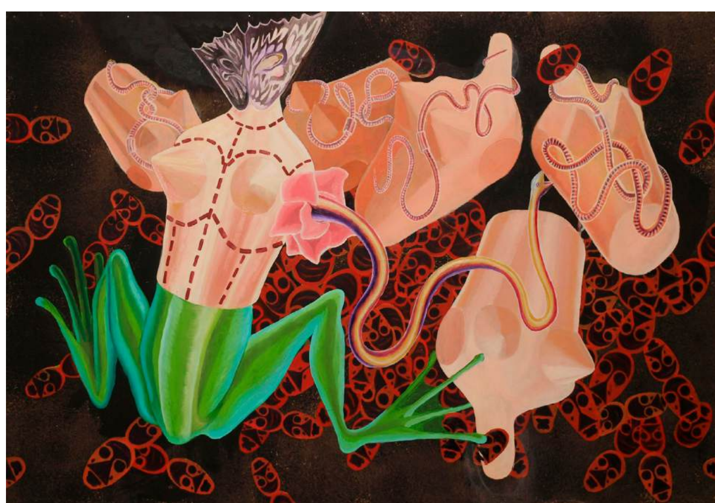
Urok Morfoz, 2026, akril, olje, lesena plošča, 120 x 178 cm