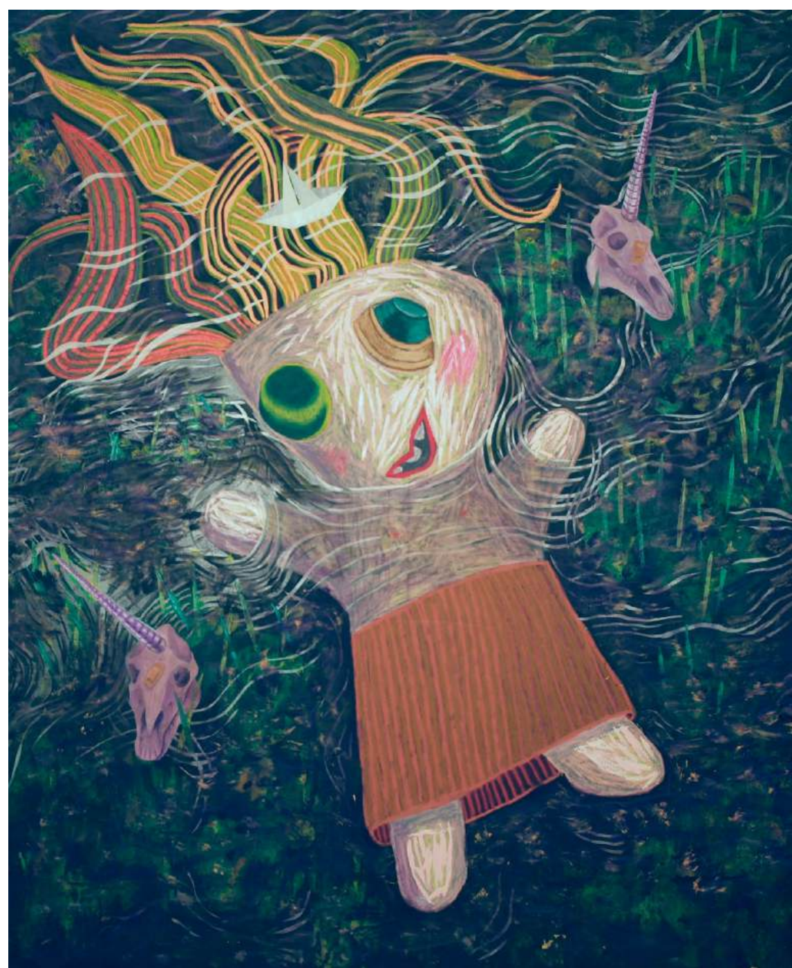
Ofeleja, 2026, akril, olje, oljni pastel, platno, 200 x 160 cm