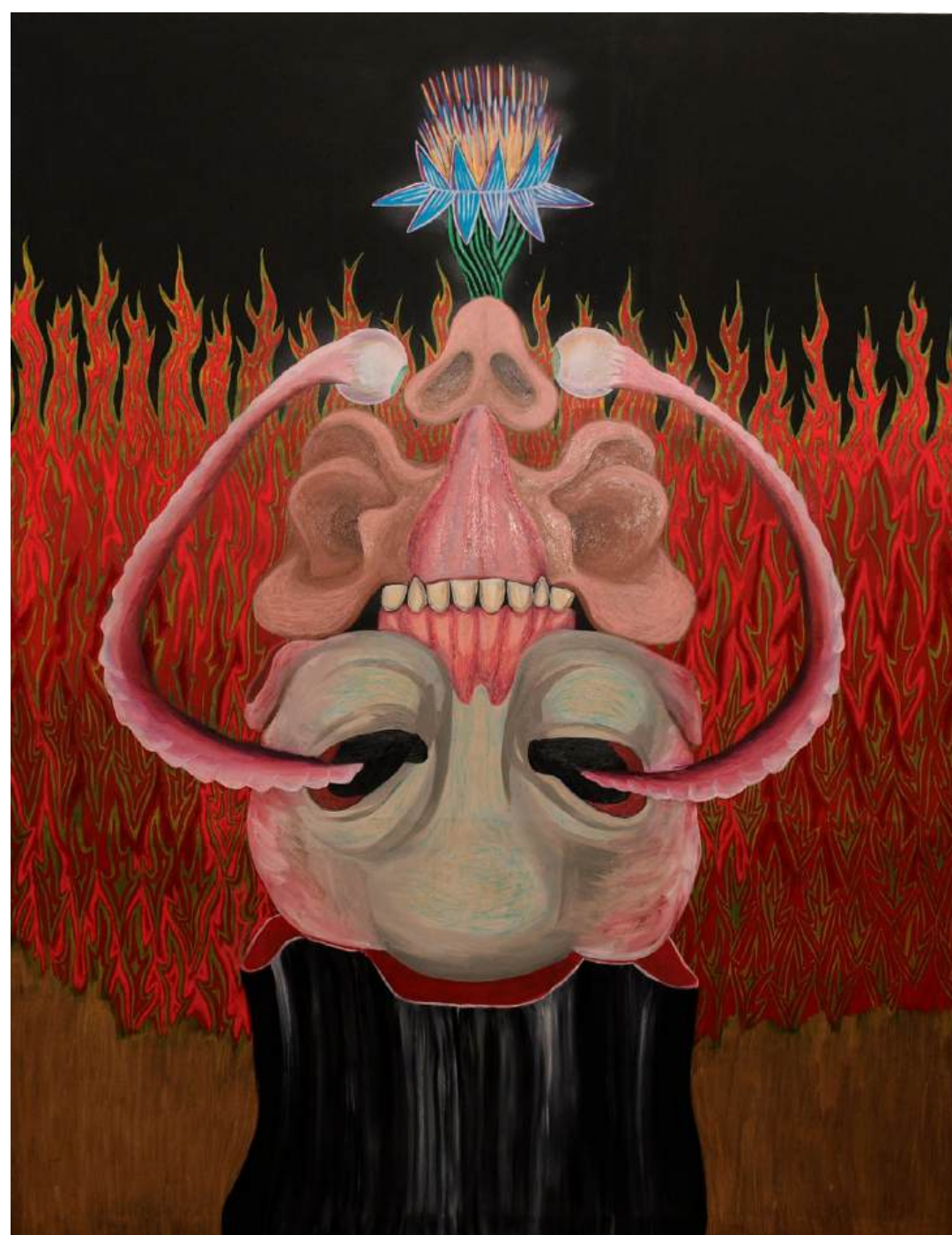
Daritev cveta čutil, 2026, akril, olje, oljni pastel, platno, 200 x 150 cm