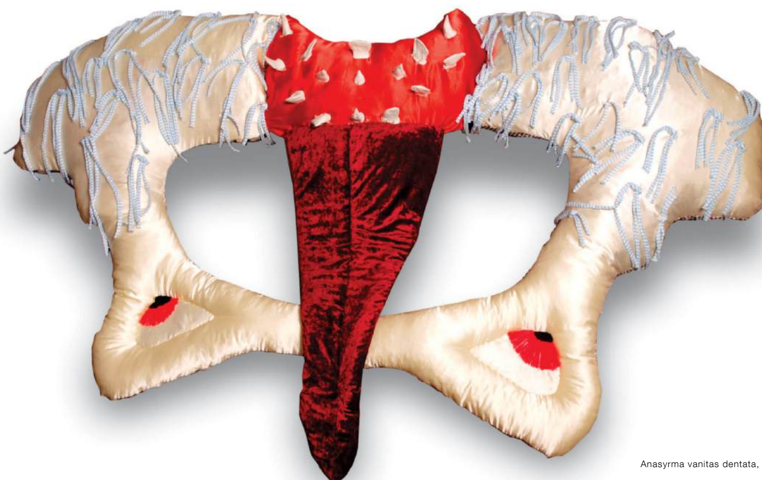
Anasyrma vanitas dentata, 2026, tekstilni objekt, 130 x 210 cm