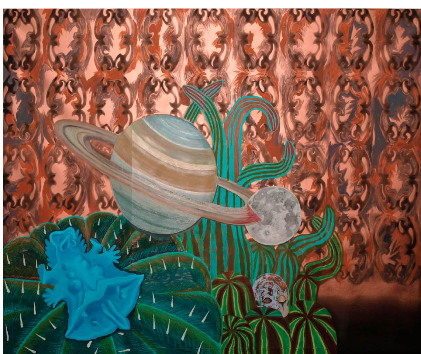
Oltar leu Saob Sati, 2026, sprej, akril, olje, ojni pasteli, platno, 162,5 x 202,5 cm