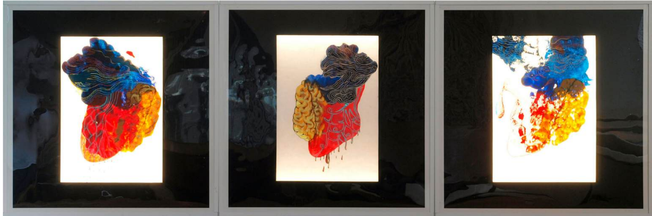
13. do 15. Puščavski dež, 2025, akril, posca flomastri, papir (svetlobnik), 6 x 60 x 60 cm